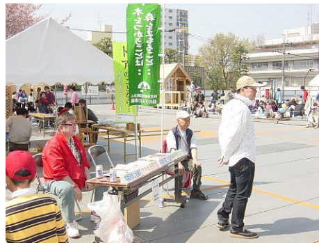
昨年の「桜まつり」の様子